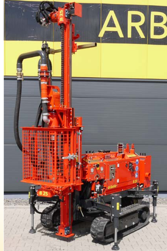
ADLER-Bohrgerät auf ADLER-Raupenfahrwerk