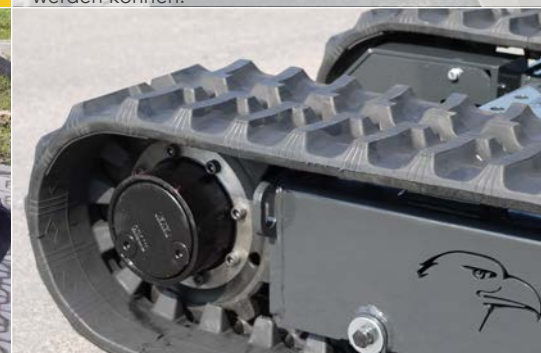
Qualitätsmotoren sorgen für ein gutes Drehmoment und die gewohnte ADLER-Leistung.