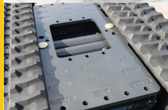
Das Mittelstück des Fahrwerkes verfügt über viele Anschraubpunkte, die kundenspezifisch genutzt werden können.