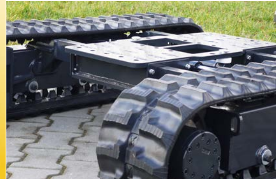
Eine stabile Stahlbauausführung sorgt für eine lange Lebensdauer der Fahrwerke.