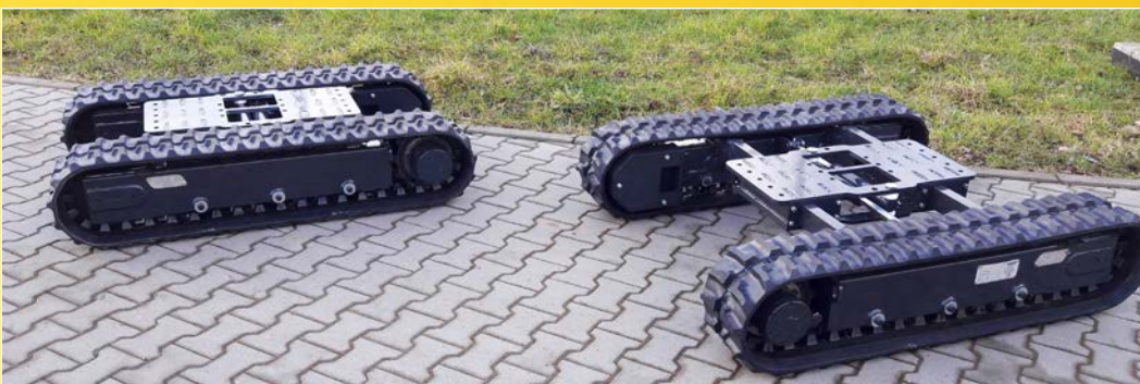
Die Fahrwerke können wahlweise starr oder hydraulisch teleskopierbar gefertigt werden.